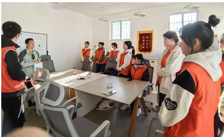
图 39 英语系学生开展刘家堡非遗研学

学校基础教学部开展了“典耀中华暨三晋未来工匠读书行动”系列活动。以立德树人为根本，通过讲经典、读经典、诵经典、写经典、演经典五项行动，创新经典阅读实践，深入挖掘中华文化精髓，共评选出团体奖 8 个，个人项目一等奖 25 个，二等奖 40 个，三等奖 55 个，立足经典育人，弘扬中华优秀传统文化。