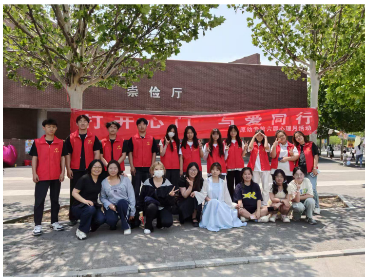
图 7 心理月系列活动合影