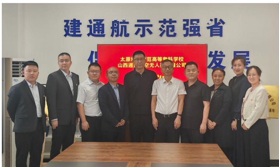
图 46 学校与山西通用航空无无人机有限公司“战略合作，双赢发展”框架合作协议签订仪式