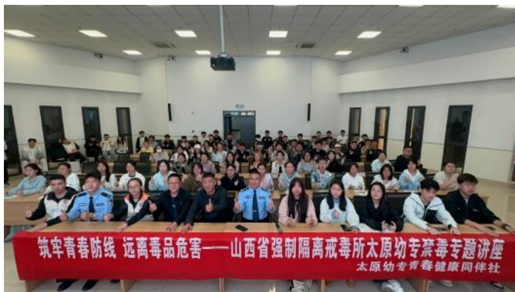
图 6 “致青春，不‘毒’行”——禁毒讲座现场