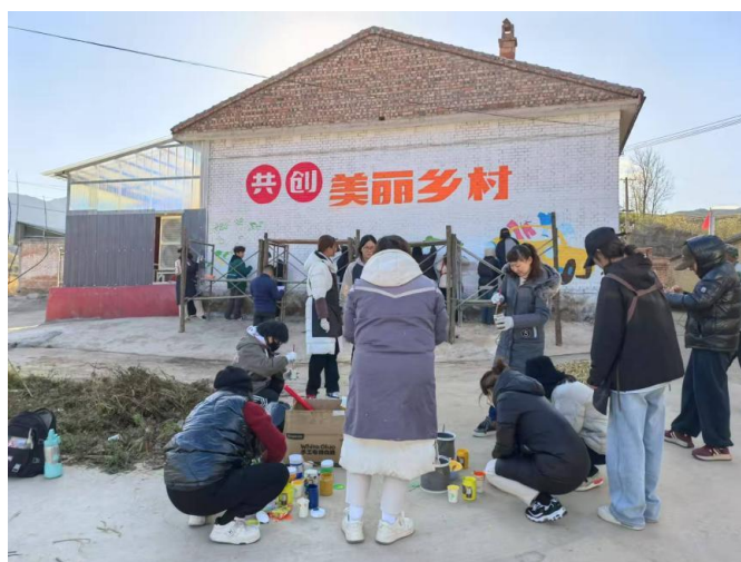
图 27 教师和学生代表赴娄烦县开展“党旗指方向 美化扶贫村”主题党日活动

这些墙绘作品不仅美化了乡村环境，更成为了乡村文化传承与创新的新载体，吸引了众多村民和游客驻足欣赏，赢得了广泛赞誉。此次南岔村墙绘项目，为美术系学生提供了宝贵的实践平台，让他们在真实的项目中积累经验，提升了艺术创作、团队协作以及沟通交流等多方面的能力。同时，也为职业教育如何与乡村振兴深度融合提供了成功范例，进一步拓展了职业教育的社会服务功能与价值内涵。