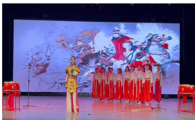
图 40 典耀中华暨三晋未来工匠读书行动

学校基础教学部开展了“典耀中华暨三晋未来工匠读书行动”系列活动。以立德树人为根本，通过讲经典、读经典、诵经典、写经典、演经典五项行动，创新经典阅读实践，深入挖掘中华文化精髓，共评选出团体奖 8 个，个人项目一等奖 25 个，二等奖 40 个，三等奖 55 个，立足经典育人，弘扬中华优秀传统文化。