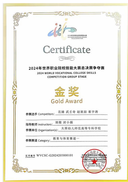
图 18 2024 年世界职业院校技能大赛总决赛教育与体育赛道金奖获奖证书

参加 2024 年世界职业院校技能大赛总决赛教育与体育赛道（幼儿教育技能组）争夺赛，太原幼儿师范高等专科学校范婧、武壬奇、赵宸喆、崔宇涛四位同学组成的团队脱颖而出，勇夺金奖，为山西职教赢得了荣誉。2025 年 2 月，金奖指导教师姚敏、封小娟被认定为 2024 年度山西省职业教育教学名师。