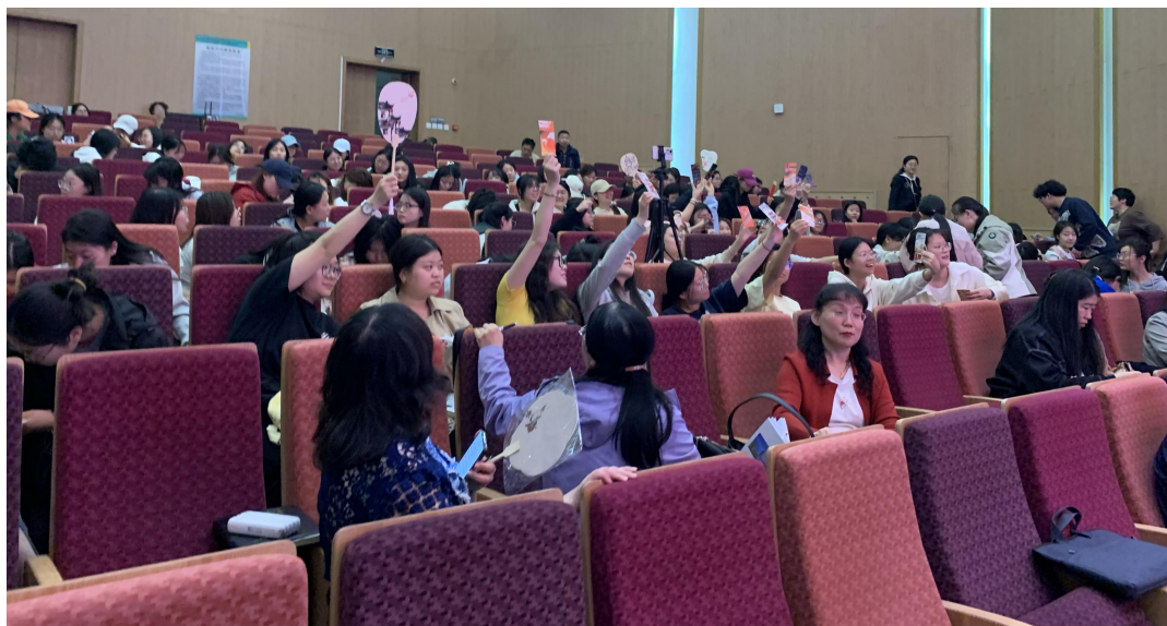
图 35 《“幼”见“晋”彩》专题教学课堂场景

学校开展非遗创新转化——中华优秀传统文化组“烟火人间”计划，近 300 名学生参与“烟火人间·风味传承”打卡活动，挖掘地域饮食文化。调研山西刀削面、莜面栲栳栳等非遗小吃历史渊源。通过创意表达，创作手绘菜单、短视频《舌尖上的晋味》，社交媒体播放量超 2 万次。优秀作品录入课程资源库，成为《“幼”见“晋”彩》专题教学案例。引导学生利用假期走访平遥古城、晋祠等 11 处乡村文化遗产地，通过测绘手稿、全景影像记录濒危古建。通过微信等平台发起“古建守护者”打卡活动，获得广泛传播与积极反响，唤起公众对乡土遗产的关注。