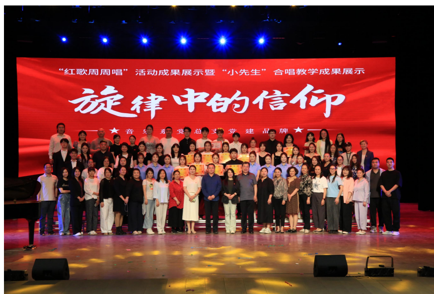
图 5 “红歌周周唱”活动成果展示

通过高标准选聘、多元化构成、全过程考核等举措，打造出一支政治强、业务精、纪律严、作风正的新时代育人队伍，按照师生比不低于 1:200 的比例配齐配强辅导员。制定《太原幼儿师范高等专科学校绩效工资（辅导员津贴）考核方案》，全面、客观、公正评价辅导员工作，实现辅导员考核工作的制度化、规范化和科学化，充分发挥考核工作对辅导员履职情况的鉴定、激励和导向作用。修订并完善《辅导员工作规定》、《学生违纪处理规定》、《太原幼专辅导员工作手册》，学生管理有的放矢。开展分层次、多模块、多形式的辅导员学习讲座，加强经验交流。每月开展一次辅导员心理工作督导沙龙，帮助辅导员及学工老师处理日常工作中常见的学生心理问题。