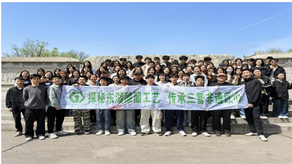
图 38 英语系学生东湖醋文化园研学实践活动

专业学生们前往老西醋博园开展研学实践活动。学生走出课堂，走进传统工艺的世界。通过实地参观、亲身感受和动手实践，对传统酿醋工艺和非遗文化有了全新的认知。