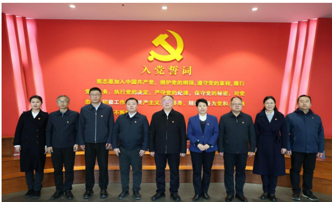
图 47 中国共产党太原幼儿师范高等专科学校委员会委员合影

2024 年 12 月，召开中国共产党太原幼儿师范高等专科学校党员大会会议审议通过《中国共产党太原幼儿师范高等专科学校委员会工作报告》，审议通过《中国共产党太原幼儿师范高等专科学校纪律检查委员会工作报告》，审议通过《中国共产党太原幼儿师范高等专科学校委员会关于党费收缴、使用和管理情况的报告》，选举产生新一届中国共产党太原幼儿师范高等专科学校委员会委员 9 人，选举产生新一届中国共产党太原幼儿师范高等专科学校纪律检查委员会委员 5 人。