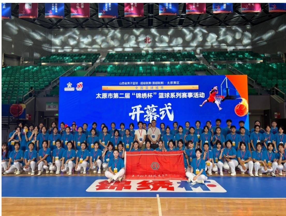
图 25 学校参加太原市第二届“锦绣杯”篮球系列赛事志愿活动

通过校企合作、校地共建，搭建实践平台，提升学生实战能力，全年参加各项服务性艺术实践演出 20 余场。特别是出色地完成了“太原市运动会开幕式文艺演出”开篇、高潮、结尾三个篇章的舞蹈节目，获得社会各界广泛赞誉，有效提升了学生综合素质和专业素养，为地方文化繁荣贡献力量。