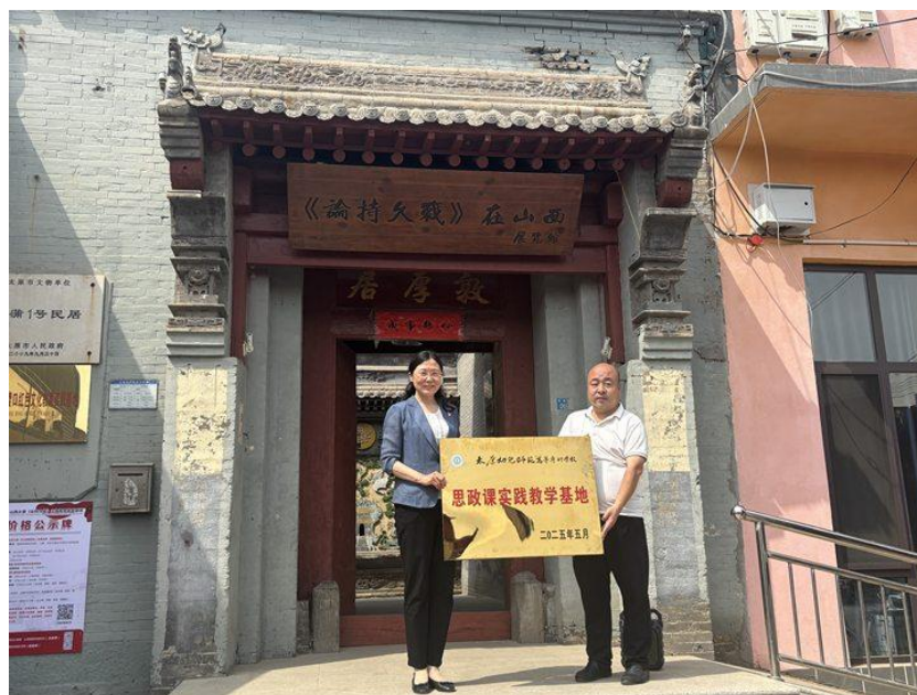
图 2 《论持久战》在山西思政课实践教学基地挂牌现场

实践育人形式丰富多样。开展《传承红色基因 砥砺青春前行》《油画中的党史》《传承非遗文化，增强文化自信》等课堂实践教学，组织《追溯春节记忆 传承非遗薪火》实践活动，引导学生厚植家国情怀，坚定文化自信，提升学生的课堂参与度、满意度。建设晋中市灵石县团委签订“三下乡”社会实践教育基地，组建团队 13 支，实施“三下乡”“返家乡”等社会实践项目，深入红色基地，进行研学、走访和 VR 全景拍摄。结合“五四”青年节、国庆节，“一二·九”运动纪念日、烈士纪念日等重要时间节点，开展“我与国旗同框”、“青春献礼庆华诞，担当铸就新辉煌”等形式多样、内涵深远的主题活动，激励学生成长，激发青年学生的爱国热情和奋斗精神，推动校园文化建设与青年发展。