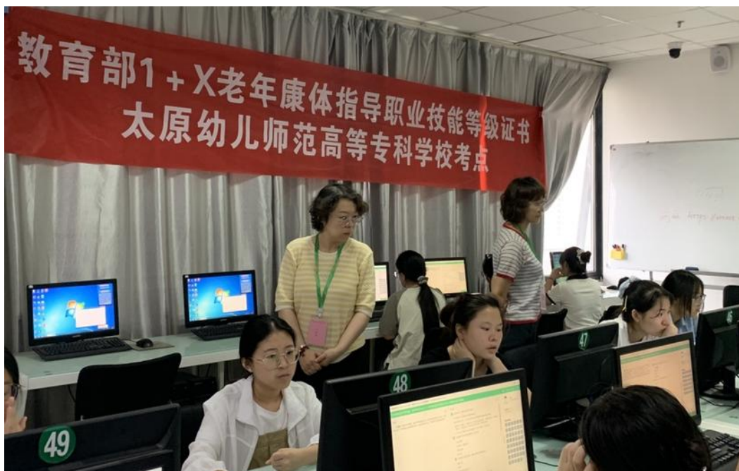
图 11 “1+X” 老年康体指导职业技能等级证书考试现场