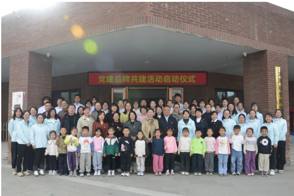
图 50 音乐系党总支党建品牌共建活动启动仪式

以“选、育、管、用”为核心，完善组织员队伍建设，打造政治过硬、业务精湛、作风优良的专职党务工作队伍，将组织优势融入立德树人主战场。