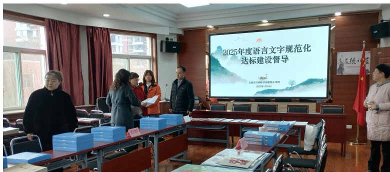
图 32 基础部教师服务 2025 年度语言文字规范化达标建设督导

学校作为山西省普通话测试站试点，秉承服务地方发展的宗旨，依托语言文字、中华优秀传统文化传承及师范素养培养方面的专业优势，积极履行社会责任，将高校的专业资源有效转化为服务社会发展的实际贡献，展现服务地方教育文化事业的担当，深化国家通用语言文字推广普及，协助太原市语言文字测试中心共开展两次普通话测工作。第一次完成 1303 人测试，第二次完成 2600 人测试。