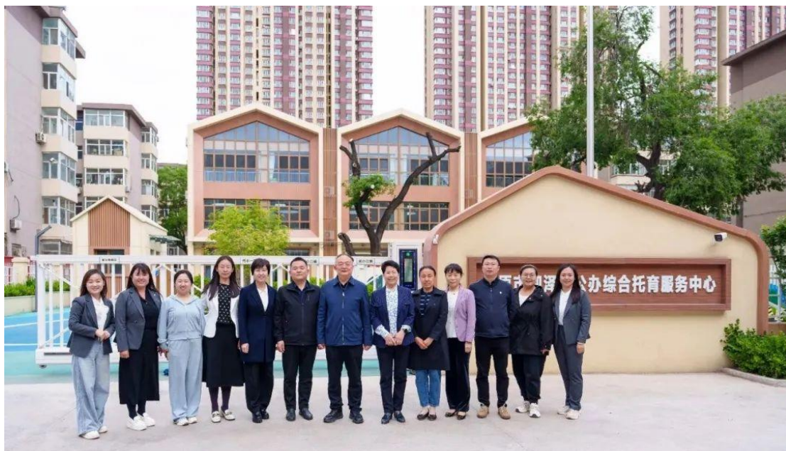
图 45 学校与太原市迎泽区公办综合托育服务中心开展深度交流座谈会