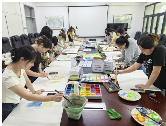
图 29 国画工作室 20 名学生为附属幼儿园创作“园区活动”“传统文化”主题绘画 24 幅

表赴晋中市灵石县开展暑期实践活动,并与当地团县委签订“三下乡”教育实践基地,搭建学生社会实践平台。