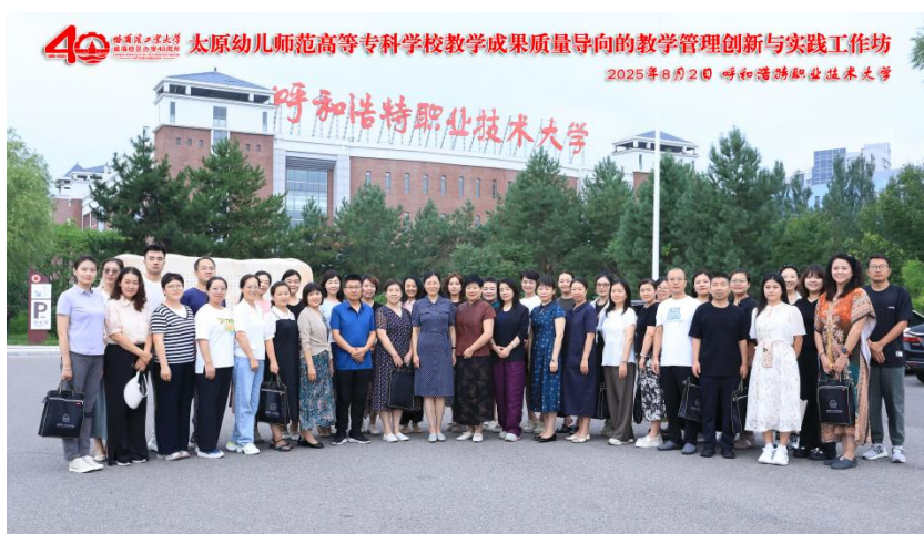
图 14 暑期教学管理创新与实践工作坊培训