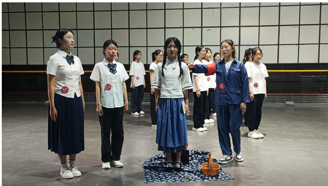
图 13 小先生实践技能培训展示现场

小先生技能训练。打破专业与系部的壁垒，为学生搭建提升自我的广阔平台，推行“素质提升项目”——小先生实践技能培训活动。267 人次小先生实践 7218 课时，极大提升学生专业技能，丰富校园文化生活。