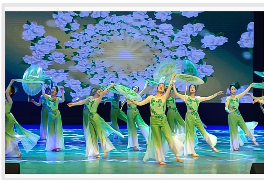
图 34 学生演出清徐县主题文化舞蹈剧目

太原幼儿师范高等专科学校舞蹈系与山西华夏之根艺术团共同合作舞剧《牧童遥指杏花村》，并于 9 月 18 日、19 两日在山西大剧院参加山西省庆祝中华人民共和国成立 75 周年系列文化活动第四届山西艺术节第十八届山西省杏花奖评比展演。参与排练的学生共有 22 名，女生 14 人，男生 8 人，女生在舞剧中承担了 4 个舞段，分别是“新杏花”“酒仙”“仕女图”“清明”，充分展现了学校舞蹈特色育人教育。