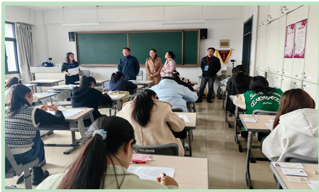
图 31 学生进行 1+X 实训考试