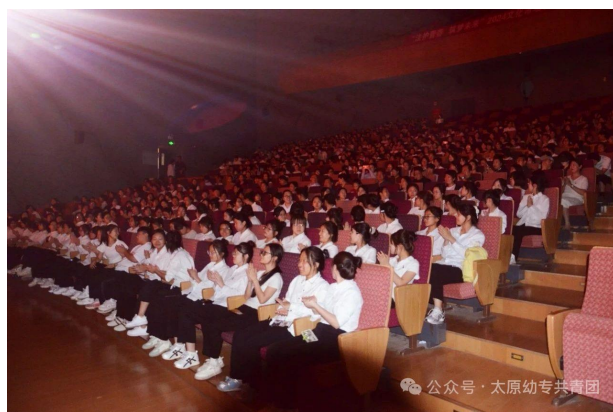
图 52 团课现场

贯彻中央八项规定精神，狠抓关键节点廉洁纪律倾向性、易发性问题，在中秋、国庆等节假日期间通过公众号和“一家亲”教职工群等及时发布《关于廉洁过节的提醒函》，提醒党员干部和广大教职员工加强节日廉洁自律和厉行节约，无论是“八小时之内”，还是“八小时以外”，都坚持本心、始终如一。