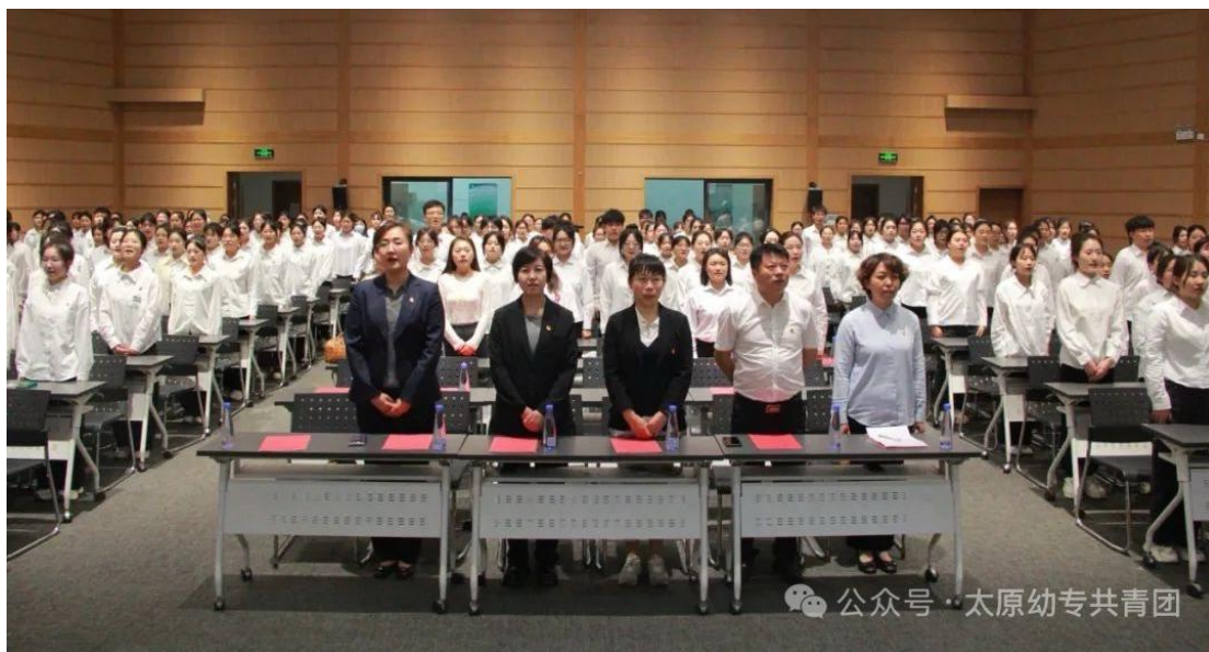
图 4 新团员入团仪式