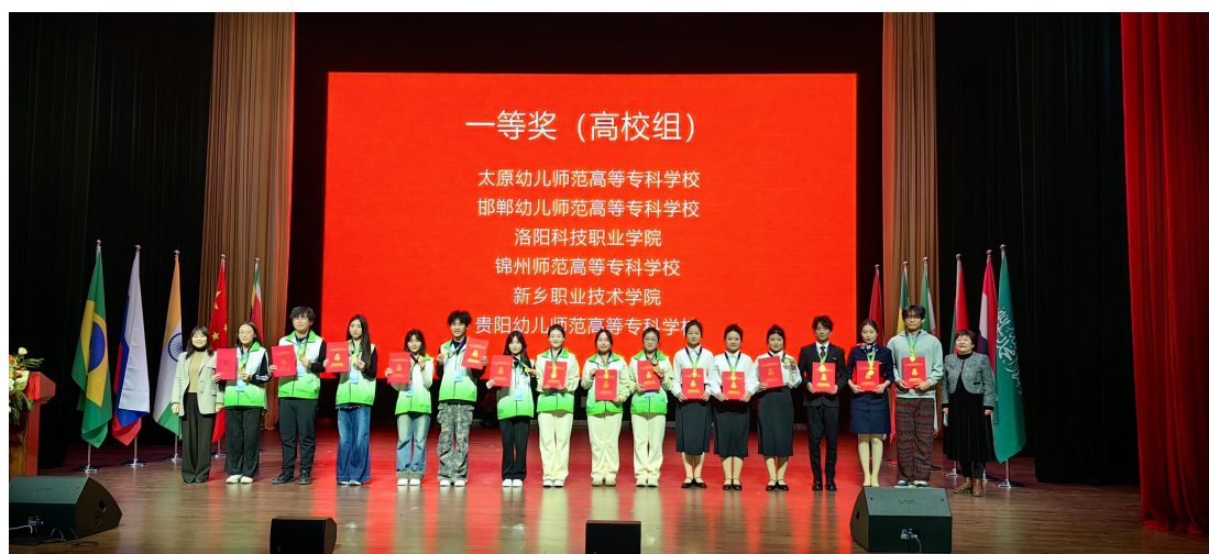
图 41 2025 一带一路暨金砖国家技能发展与技术创新大赛颁奖现场

面对来自全国的 60 支本专科参赛队伍，我校学生团队凭借扎实的专业素养与出色的语言能力脱颖而出，最终斩获高校组一等奖第一名的优异成绩，充分展现了太原幼专学子敢闯敢拼、积极向上的精神风貌，为校争光！