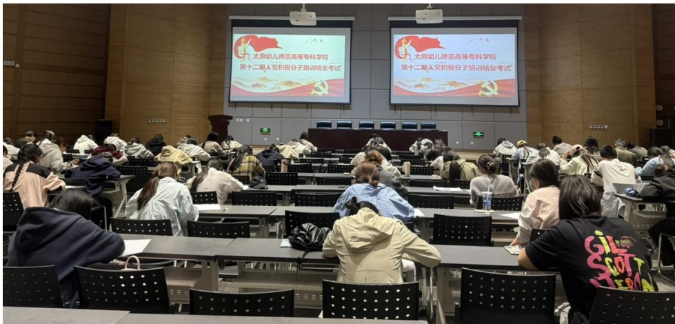
图 51 入党积极分子党的知识与理论考试现场

座”模式，实现党员教育培训全覆盖。2024 年组织 2 期入党积极分子及 1 期发展对象培训，228 人获结业证书；2025 年组织 1 期入党积极分子培训，124 人获合格证书。2024 年发展党员 50 名（教工 11 名、学生 39 名），2025 年上半年发展 60 名（教工 9 名、学生 51 名），均注重从高层次人才、优秀青年教师中发展党员，把更多品学兼优、符合党员条件的师生源源不断吸收到党内。依托全国党员信息化管理平台，顺畅完成毕业生与教职工党员组织关系转接（2024 年转接 40 人，2025 年规范流程）；严格党费核算收缴，每年 3 月依据新基数重新核算，按月核对变动信息、下发收据，确保账目清晰。严格执行党费收缴制度，准确核算党费并按时下发各系部，完善台账管理与流程规范，确保收缴工作严谨有序，经各位党员老师签字核对确认后上报太原市委教育工委。