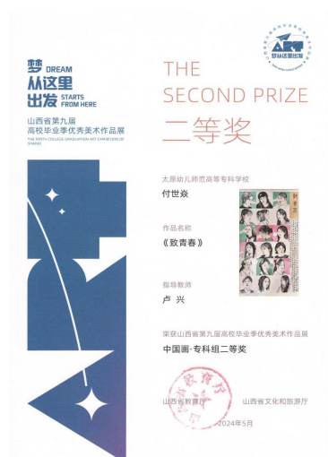
图 19 “梦从这里出发”美术作品《致青春》获奖证书

参加“梦从这里出发”美术作品展，《致青春》《晋风民居》等作品获专科组二等奖 4 项、三等奖 9 项。