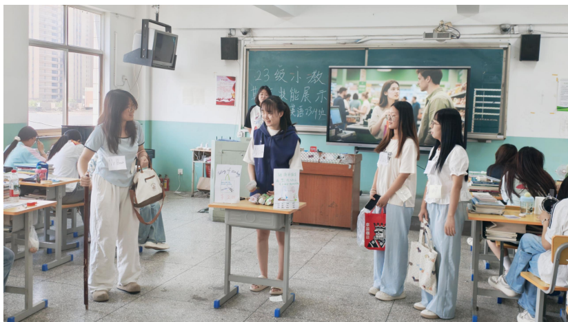
图 10 学生课堂教学展示

依据学前专业认证标准，对《信息技术》与《现代教育技术》两门课程进行知识图谱的系统化重构，构建与新一代信息技术发展动态