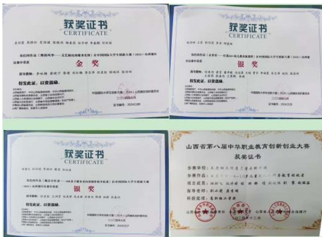
图 20 创新创业大赛获奖证书

筹备，严格选拔，我校共计推荐 460 个项目参加了山西省创新大赛，其中有 23 个项目进入省赛评审阶段，最终获得两金、两银、一铜一优秀的骄人成绩。参加 2024 年 11 月举办的山西省职教社举办的创新创业大赛，经过我校师生的努力拼搏，获得高职组二等奖的好成绩。