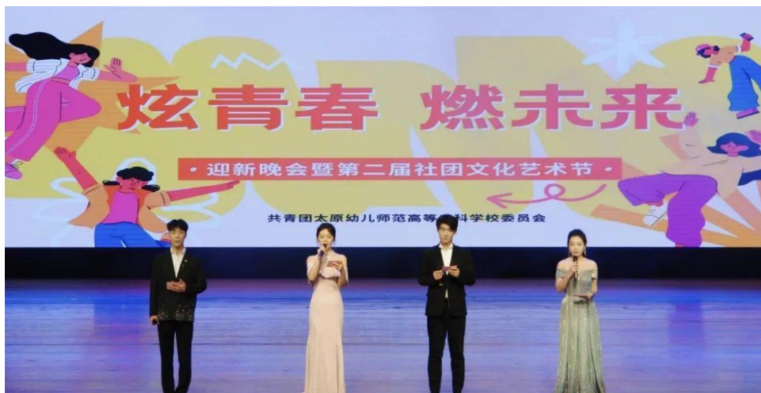
图 12 学生社团文化艺术节活动现场