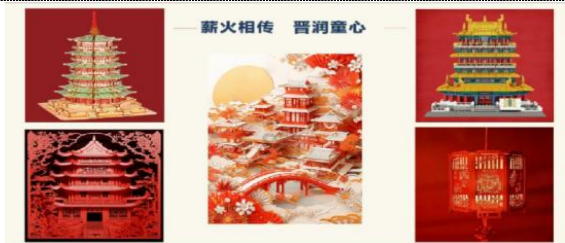
图 37 “幼”见“晋”彩讲座展现中华优秀传统文化建筑之美

抽象文化理论转化为具象的幼教方法，让文化浸润更具针对性。活动覆盖全校各专业，每学期参与学生超 1200 人次，有效打破学科壁垒。