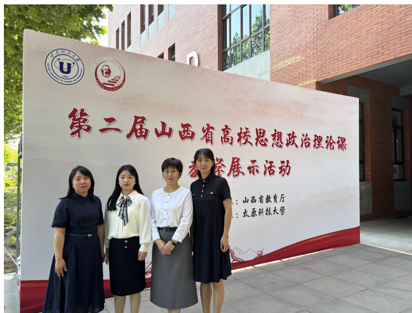
图 15 思政课教师参加第二届山西省高校思想政治理论课教学展示活动