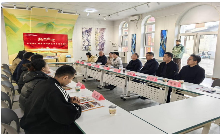
图 42 学校和山西康迪文教集团举行“校企合作 协同育人”座谈交流会

场馆，如大剧场、体育馆、双创基地、无人机馆等。通过这种方式，校企双方将携手共进，形成强大的教育合力，共同促进协同育人，为推动教育事业的发展贡献更大的力量。座谈会后，大家一起参观了百院非遗刘家堡研学基地，乡村振兴下新农村的新气象、历史名人王琼的廉洁精神、非遗小院的传统文化，让与会人员都深刻认识到传统文化传承与创新的重要意义。此次座谈交流与参观活动，为太原幼专与山西康迪文教集团的合作奠定了坚实基础。相信在双方的携手努力下，未来必将在“校企合作 协同育人”的道路上结出更加丰硕的成果，为教育事业的繁荣发展贡献更大的力量。