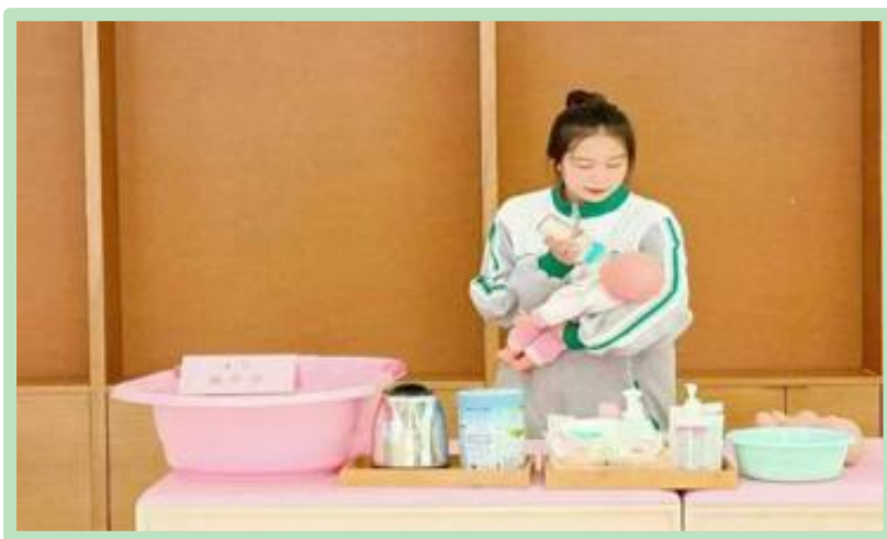
图 30 学生进行 1+X 实训练习

通过“岗课赛证”综合育人模式，将职业资格证书考试课程与专业课程教学相衔接，做到课程与考证相结合，课程与职业资格证书融合，加强了学生在相关知识点的实训项目活动，提升了学生就业能力和就业率。