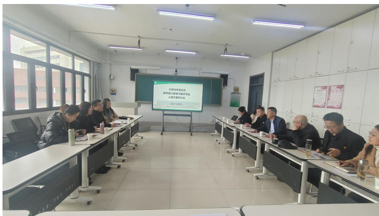
图 9 研学专业人培方案研讨会