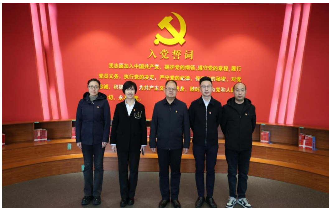
图 48 中国共产党太原幼儿师范高等专科学校纪律检查委员会委员合影

2025 年基层党组织集中换届。制定换届方案，细化任务与时间节点，覆盖 292 人次基层党务工作者培训；联合多部门联审 134 名候选人，组建督导组检查 26 个基层党组织，开展候选人履职测试，确保换届规范、人岗相适。