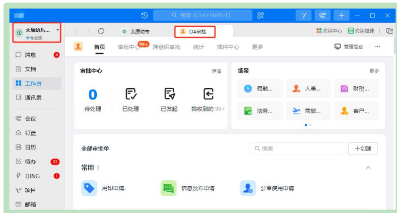
图 54 数字化校园平台界面展示