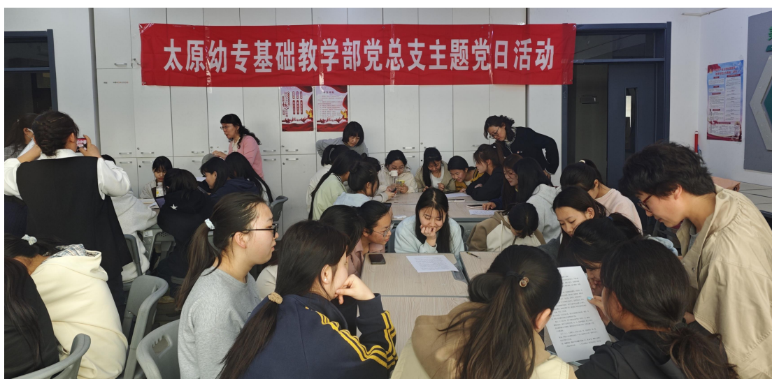
图 49 基础教学部党总支主题党日活动现场