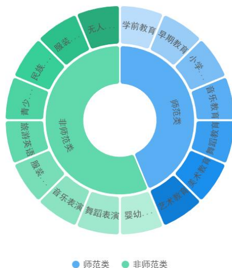
图 1 学校专业分布情况

点专业、高水平实训基地、山西省职业教育“十四五”特色专业（群），美术教育专业为山西省职业教育高水平实训基地，早期教育专业为山西省职业教育品牌专业。