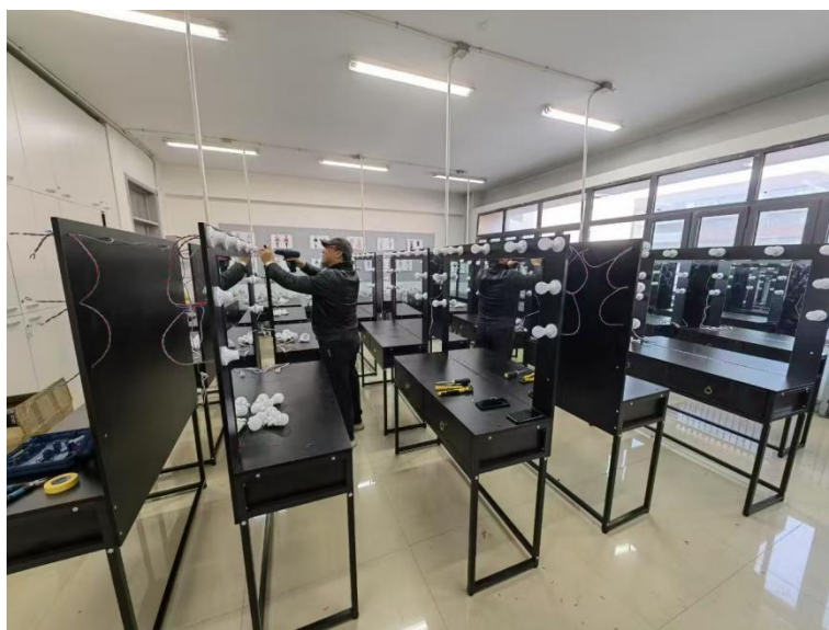
图 16 人物形象设计实训室建设

平台功能模块，打造全流程线上服务体系，为毕业生提供“一站式”就业创业服务支撑。升级改造一批实训设备，完成兴华校区学生机房设备升级，更换高性能终端设备 108 台，优化空间布局，全面改造了电源、网络布局，更换防火防盗门窗，安全隐患清零，师生满意度提升至 99%。完成 STEAM 儿童科创空间实训室、小钟琴实训室环境创设。