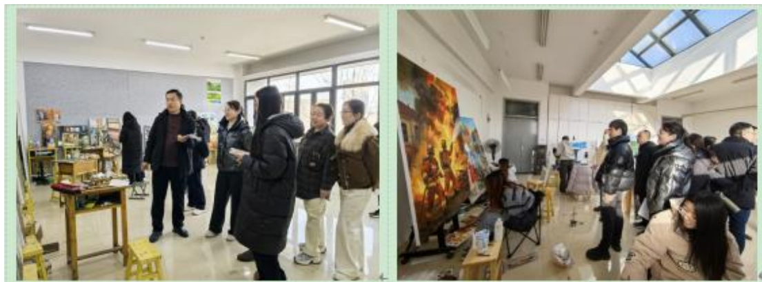
图 23 2025 年 12 月 8 日美术系教学委员会对毕业生创作进行中期审查