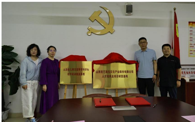
图 43 美术系与山西宏艺珠宝文化股份公司签订校企合作协议