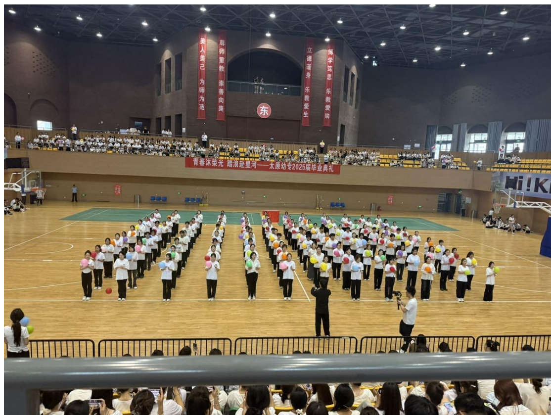
图 21 2025 届毕业典礼现场

2025 届我校共有毕业生 2098 人，其中，学前系 1391 人、美术系 131 人、舞蹈系 141 人，音乐系 173 人，英语系 187 人，思政教学 41 人，体育教学部 34 人；省内毕业生 1770 人，占比 84.37%，省外毕业生 328 人，占比 15.63%。