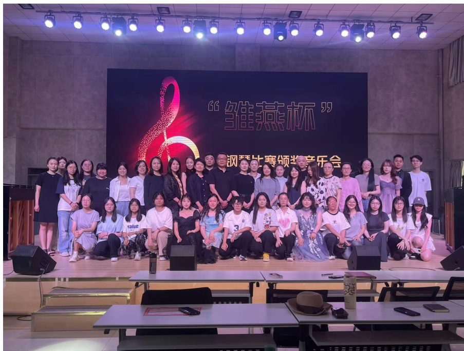
图 3 “维燕杯” 钢琴比赛颁奖音乐会现场